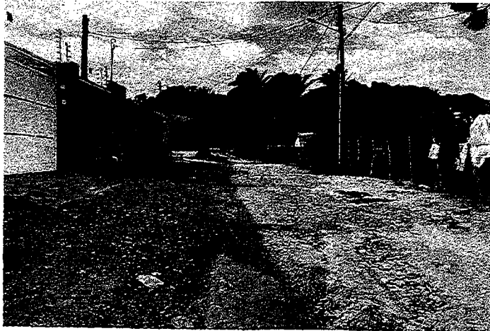
FOTO 02 - FINAL DA RUA