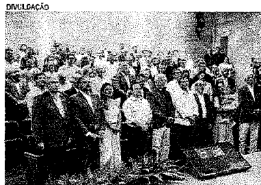
SINDICATO da Construção no Ceará comemorou 80 anos ontem. 18

A guerra e as ameaças de conflitos são outros fatores que devem preocupar investidores. O que faz Amorim acreditar que o momento de inflação em alta deve ser mais duradoura do que se previa inicialmente. Por isso, o mercado brasileiro deve ser impactado e precisa estar preparado para esse movimento.