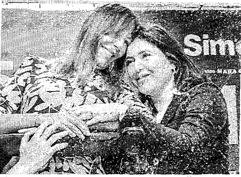
SENADORA Mara Gabrilli foi oficializada como vice na chapa de Simone Tebet

uma empresa de ônibus na cidade. "Eu vivi dentro de casa meu pai sendo extorquido pelo PT com uma arma na cabeça", disse a senadora.