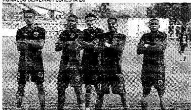
FLORESTA venceu Pacajus e Campo Grande